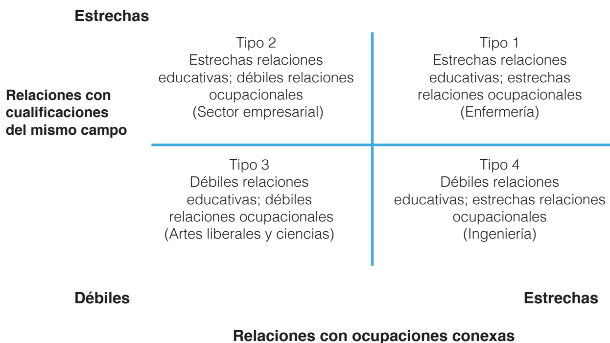
Figura 2: Tipos de cualificaciones

Fuente: adaptado de Moodie, Wheelahan, Fredman y Bexley (2015: 17) Figura 1 Cuatro tipos de recorridos en relación con las cualificaciones