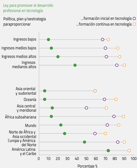
FIGURA 2: Uno de cada cuatro países tiene una ley y tres de cada cuatro países tienen una política, plan o estrategia sobre formación del profesorado en tecnología Porcentaje de países que cuentan con leyes y políticas, planes o estrategias para la formación de profesores en tecnología, por región y nivel de ingresos, 2022

GEM StatLink: https://bit.ly/GEM2023_fig9_4_