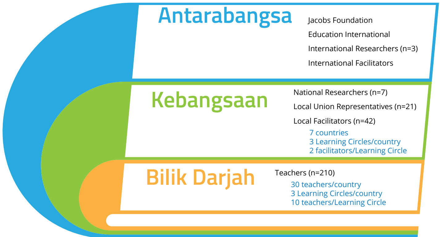
Rajah 1. Peserta Projek Learning Circles Pimpinan Guru di peringkat Antarabangsa, Kebangsaan dan Bilik Darjah

Teacher-led Learning Circles Project Participants